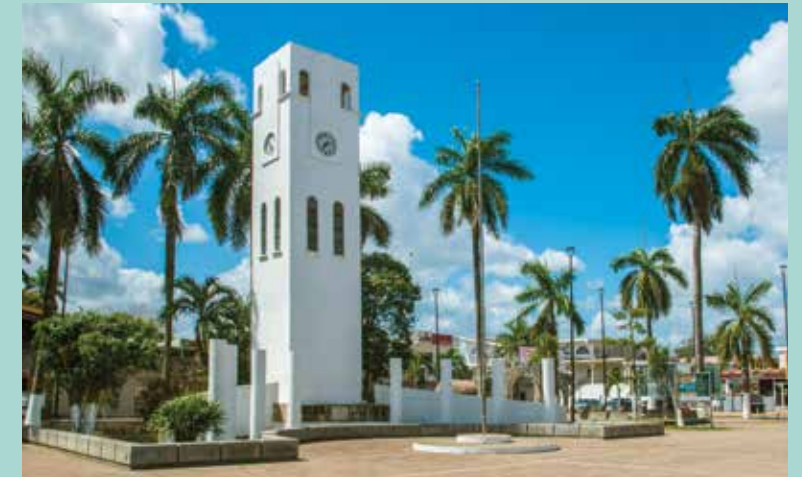
FELIPE CARRILLO PUERTO

La siguiente parada es en el Museo de la Ciudad , un recinto en el que se cuenta la historia chetumaleña desde su origen y hasta la actualidad por medio de fotografías y objetos que retratan el día a día de los pobladores. A un costado del mercado municipal, el Museo de la Cultura Maya exhibe de manera permanente la herencia maya de la región y aquí en un abrir y cerrar de ojos ya se habrá pasado la tarde mientras se observan con detalle las réplicas de las zonas arqueológicas más importantes del estado.